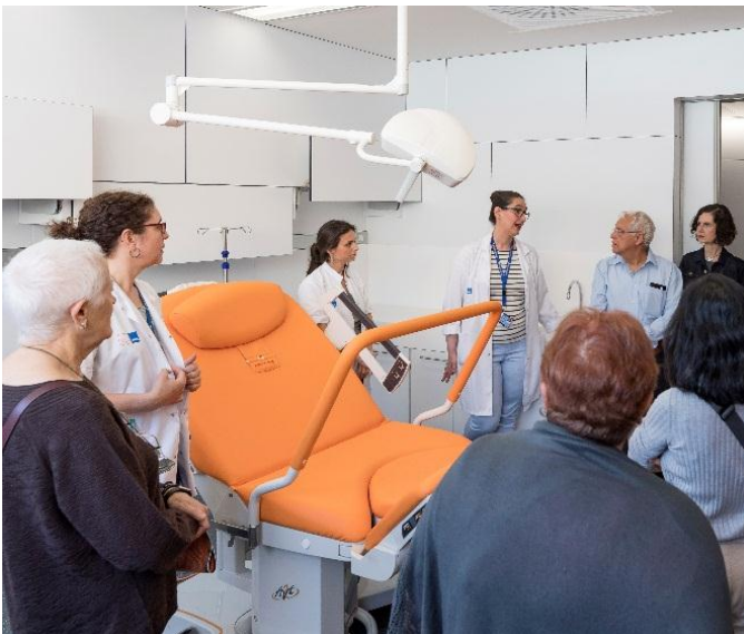
Fotografia sala de parts durant la Jornada de Portes Obertes del nou edifici