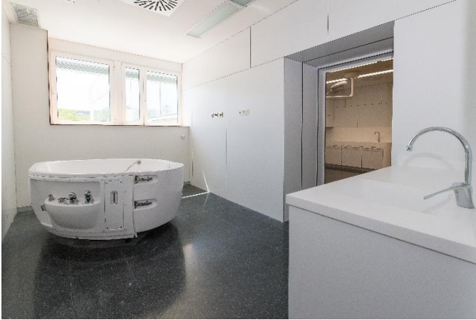
Banyera per a dilatació en medi aquàtic.